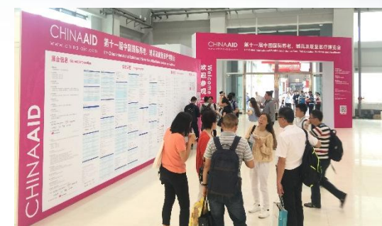
China Aid 开幕